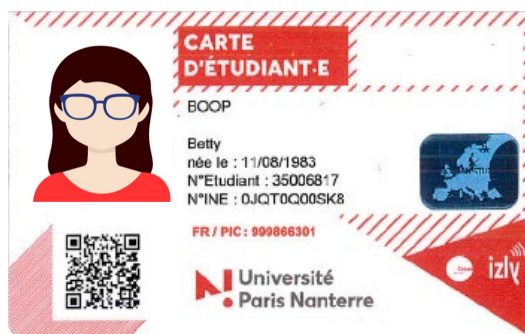
Exemple d'une carte étudiante européenne – Université Paris Nanterre

La carte étudiante européenne est un produit issu de l'Initiative carte étudiante européenne. Il s'agit de la carte étudiante habituelle complétée par un numéro européen, un QR code et un sigle.